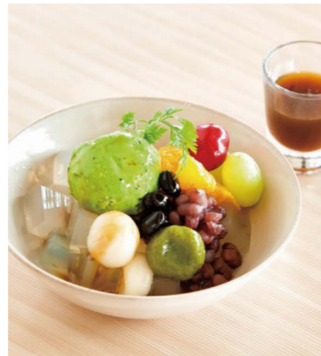
ミントとプレーン寒天の 抹茶クリームあんみつ

パニラアイス、生クリーム、スポンジ、 レアチーズクリーム、グラハムクッキー、 季節のフルーツ、いちごコンフィ、ミント