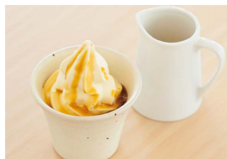
栗のソフトエスプレッソがけ