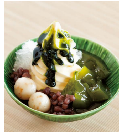
抹茶ゼリーの 冷やしぜんざい

抹茶アイス、ミント寒天、プレーン寒天、 抹茶白玉、白玉、つぶあん、黒豆、 季節のフルーツ、黒みつ