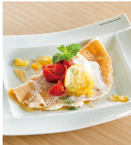
そば粉のレアチーズガレット - トマトとはちみつレモン -