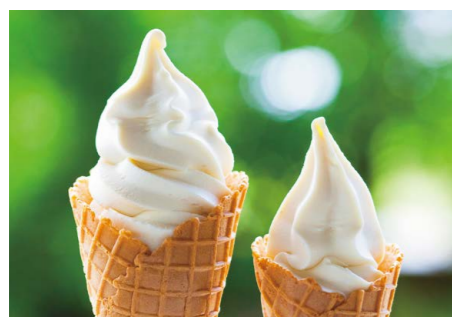
栗のソフトクリーム