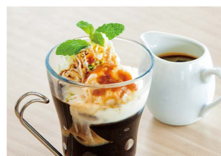
キャラメルCAFEバニラ