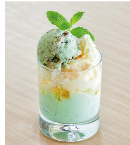
チョコミントプチパルフェ